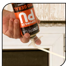
Batente de Porta e Janela

Espuma autoexpansiva de poliuretano monocomponente sem CFC para uso geral com alta expansão. É indicado para fixação em dutos e aparelhos de ar condicionado, preenchimento de batentes de portas e janelas, cumieiras, isolamento térmico e acústico. Adere em metal, madeira, alvenaria, cerâmica, mármore e granito.