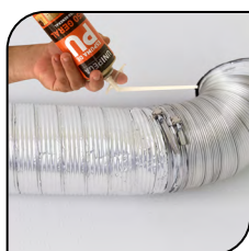
Duto de Ar Condicionado